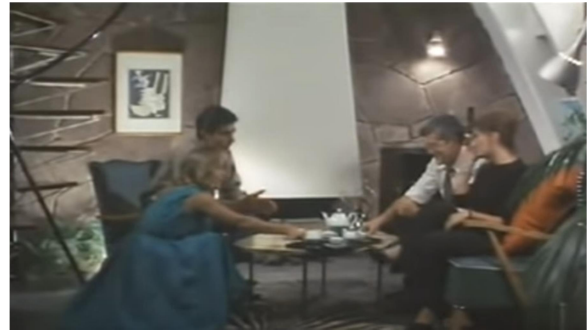
Fotograma de “Últimas tardes con Teresa”, que muestra el interior de uno de los apartamentos del ático de La Pedrera

americano” que el arquitecto Barba Corsini otorgó a estos espacios.