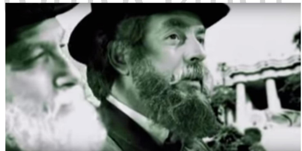
Fotograma de "Güell i Gaudí, un projecte comú", de Joan Riedweg

Está filmada en blanco y negro a excepción de las secuencias finales que simbolizan el atropello que sufrió Gaudí por un tranvía, donde en una suerte de repaso de su vida en el trance de muerte aparecen sucesivas imágenes en color de algunas de sus obras.