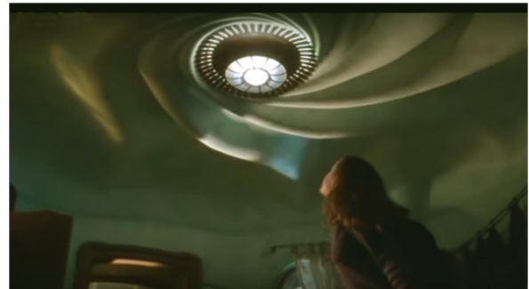
Fotograma de “Casper” que muestra la reproducción del cielorraso del salón de la Casa Batlló

En esta casa muchos de sus ambientes reproducen literalmente elementos de obras de Gaudí: Pueden verse ventanas y puertas y el cielorraso espiralado de la Casa Batlló, carpintería de La Pedrera y columnas inspiradas en el Palau Güell y la Casa Calvet, además de arcos parabólicos que recuerdan al Colegio Teresiano.