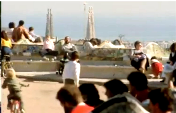
Fotogramas de “Antoni Gaudí”, de Hiroshi Teshigahara

Es también destacable la posibilidad de apreciar las cerámicas troceadas (trencadís) del tipo y colores que el arquitecto dispuso y que en gran porcentaje desaparecieron a raíz de las restauraciones llevadas a cabo en las últimas décadas.