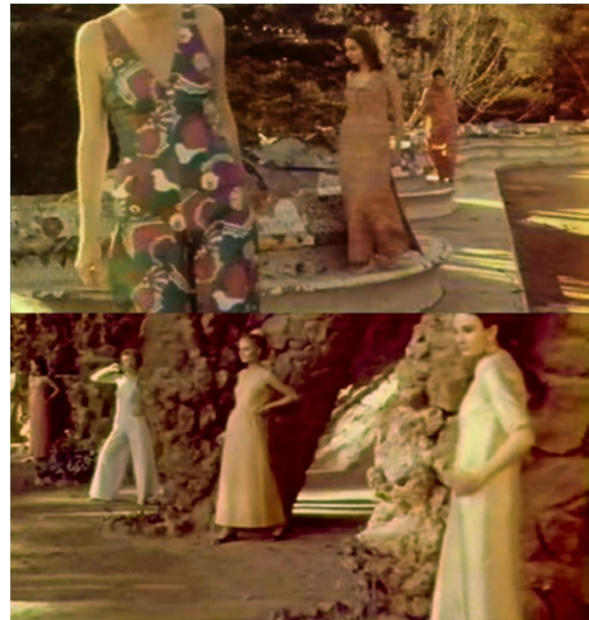
Fotogramas de “Cada vez que...”, de Carlos Durán

como reflejo de lo que ocurría en el resto del mundo. 6