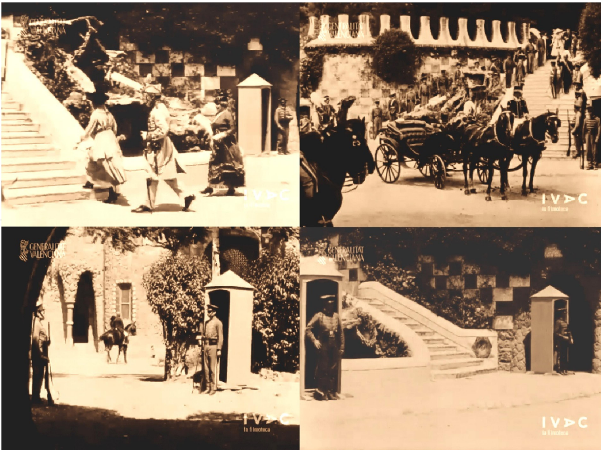
Fotogramas de “La Reina Joven”, de Magín Muriá

del palacio, donde para completar la ambientación fueron agregadas unas curiosas garitas de guardia cuyo estilo dista mucho de las creaciones gaudinianas. Hay también escenas filmadas en la columnata de la Sala Hipóstila y en los viaductos.